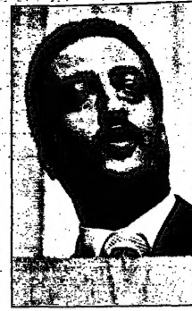
الدكتور ناصر زيد الامام وزير الداخلية

بمحاولة تفجير المبنى الذي يضم مقره... (Text detailing the investigation into the bombings in Amman.)